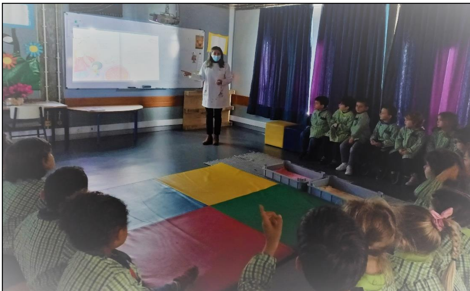
Conto (Turma 002)

Conversa sobre os direitos das crianças. (Turma 002)