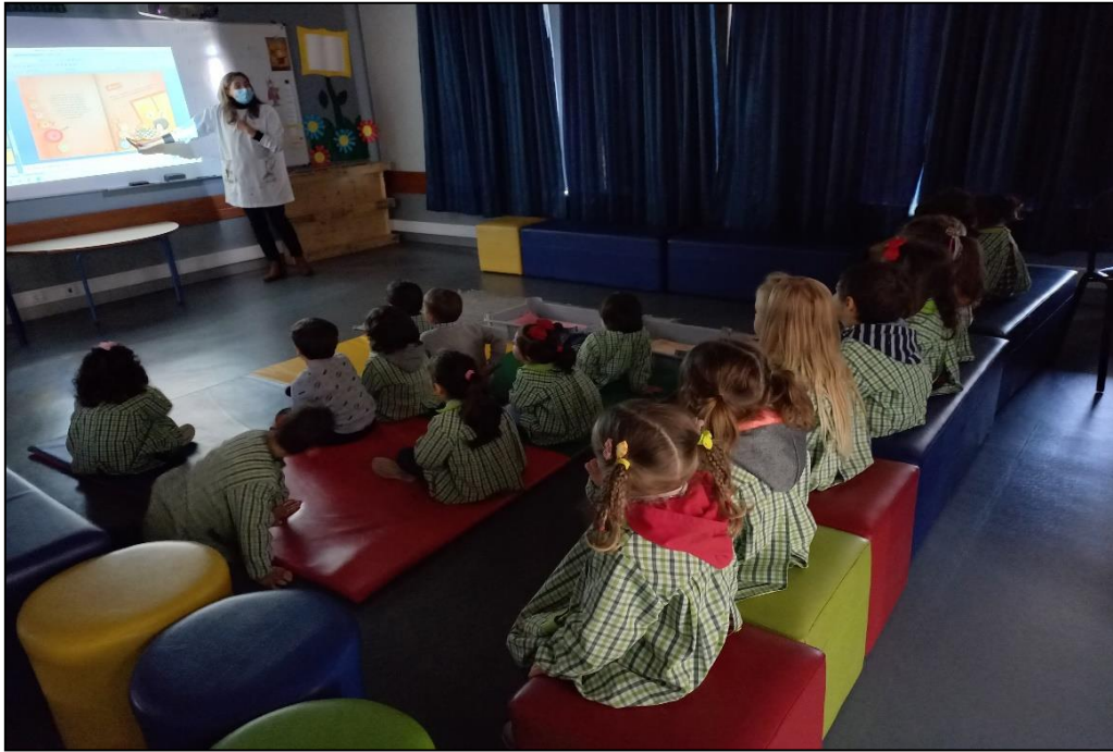
Conto (Turma 001)