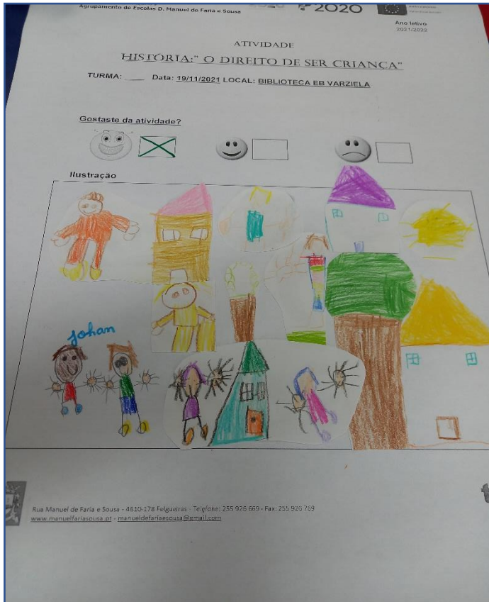
Registo coletivo da história (Turma 002)