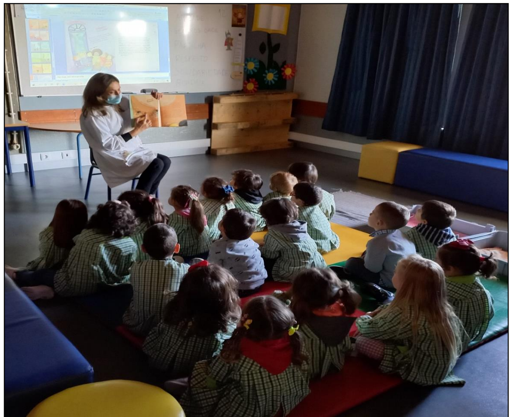
Conversa sobre os direitos das crianças (Turma 001)